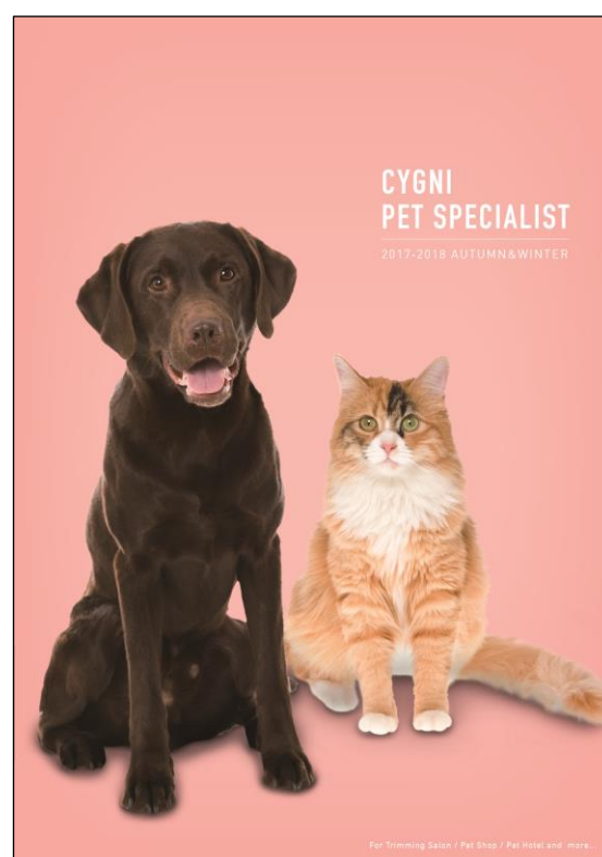
2017-2018 AUTUMN&WINTER 表紙

シグニペトスペシャリストは、ペットショップおよびペットサロン向けにフード・シャンプーなどの消耗品や、ドライヤーやドッグバスなどのショップ備品など、店舗運営に必要な商材を幅広く取り揃えた総合卸カタログです。WEB サイト ( http://specialist.cygni.co.jp/ ) 及びカタログでご注文いただけます。